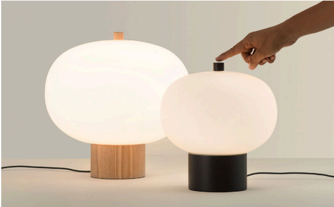
With Touch Dimming. Avec Touch Dimming.