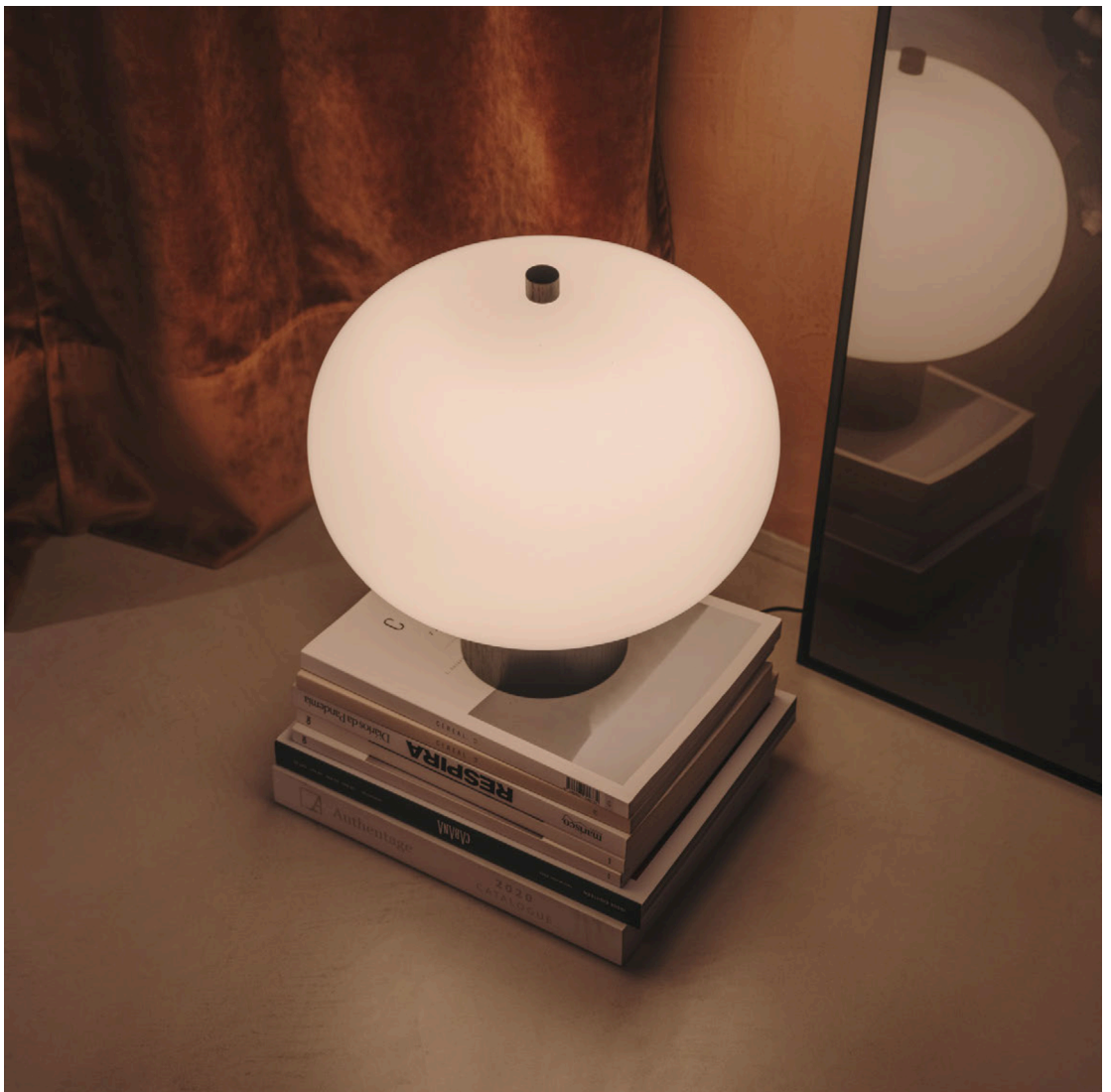
Base made from solid wood with an ash or black finish and an opal glass diffuser. Socle en bois massif avec finition frêne ou noire et diffuseur en verre opalin.

The warmth of a timeless design — Created by Basque designers Iratzoki and Lizaso, Ilargi is a perfect combination of warmth and timeless, functional design. Its traditionally blown glass is highly stylish, combining with solid hardwood. Its soft, pleasant light makes it perfect for residential use or public spaces, helping it to devise comfortable, natural settings.